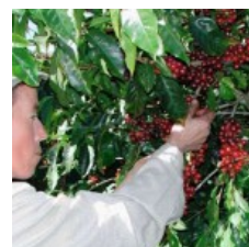
El sector cafetalero puede ser una fuente para reducir emisiones.